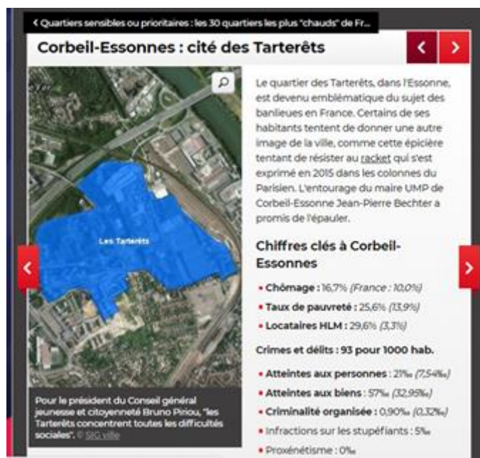
Image n° 7. Les Tarterets parmi « les 30 quartiers les plus « chauds » de France »