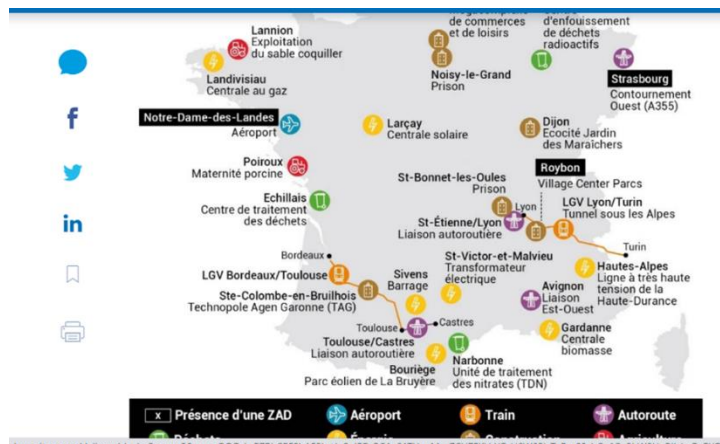
Image 3. Carte des ZAD Boursorama

Quant au site d'actualité économique Boursorama , il propose en février 2018 une carte des ZAD sur laquelle la présence de ces dernières est inscrite dans un rectangle noir ajouté en haut des pictogrammes des projets contestés.