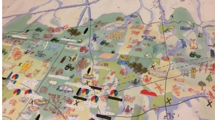
Image n° 5. La Carte de la ZAD Notre Dame des Landes selon « À la criée »