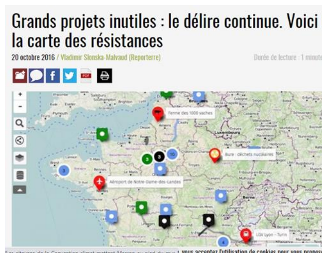
Image 2. Carte des ZAD Reporterre

En octobre 2016 4 , le journal en ligne Reporterre a fait des choix graphiques radicalement opposés : les projets abandonnés « suite à une lutte locale » sont mentionnés par des vignettes vertes.