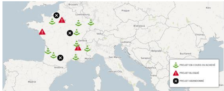
Image 1. Carte des ZAD Le Figaro

l'interprétation que l'énonciateur fait de l'action des zadistes. 3 L'énonciation multimodale texte-image retenue donne une fonction dénominative au texte – l'intitulé des projets contestés - et une fonction connotative aux pictogrammes.