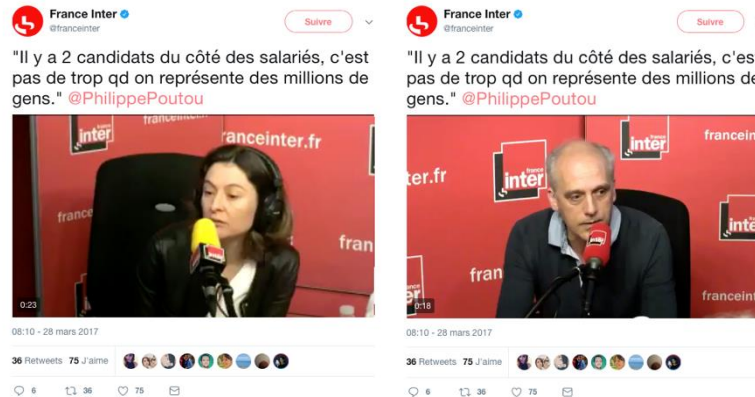
Prise en compte du message dans l'environnement Twitter

On peut alors retrouver les caractéristiques des approches « contextualisantes » décrites par (Paveau 10 , 2013) (« contextualisation technorelationnelle », « investigabilité du discours », « technoconversationnalité »). On voit sur cette image le lecteur de vidéo qui propose une interview (le contenu textuel du tweet, le discours rapporté, est en fait un extrait de cette vidéo, qui est une interview de Philippe Poutou). Un va-et-vient est rendu possible entre les deux modes d'appréhension : l'analyse contextualisée nous semble ici trouver un intérêt car elle s'est focalisée sur un message qui contenait le terme « salarié », élément visiblement saillant dans le corpus de Philippe Poutou (repérage statistique et en collocations). Si l'accès au corpus se faisait uniquement par l'interface de Twitter, nous n'aurions pas d'informations sur la spécificité de ce terme pour le candidat en question, la manière dont il en fait usage, comment il se distingue de ses concurrents par le sens qu'il lui accorde. Le discours rapporté à l'ère du numérique ne doit, selon nous, pas être analysé avec des nouveaux concepts qui « augmentent » les concepts traditionnels de l'analyse du discours, mais être analysé avec les concepts traditionnels selon une nouvelle manière de suivre les observables . S'il est impossible d'épuiser l'analyse d'un fait de discours, qui va sans cesse être repris,