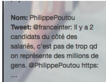
Visualisation d'un message potentiellement intéressant

C'est un tweet de @franceinter retweeté par Philippe Poutou (donc un tweet circulant, pour rejoindre la thématique du volume) : il pouvait aller dans la partie « moteur de recherche ». Il pouvait alors retrouver le tweet en question.