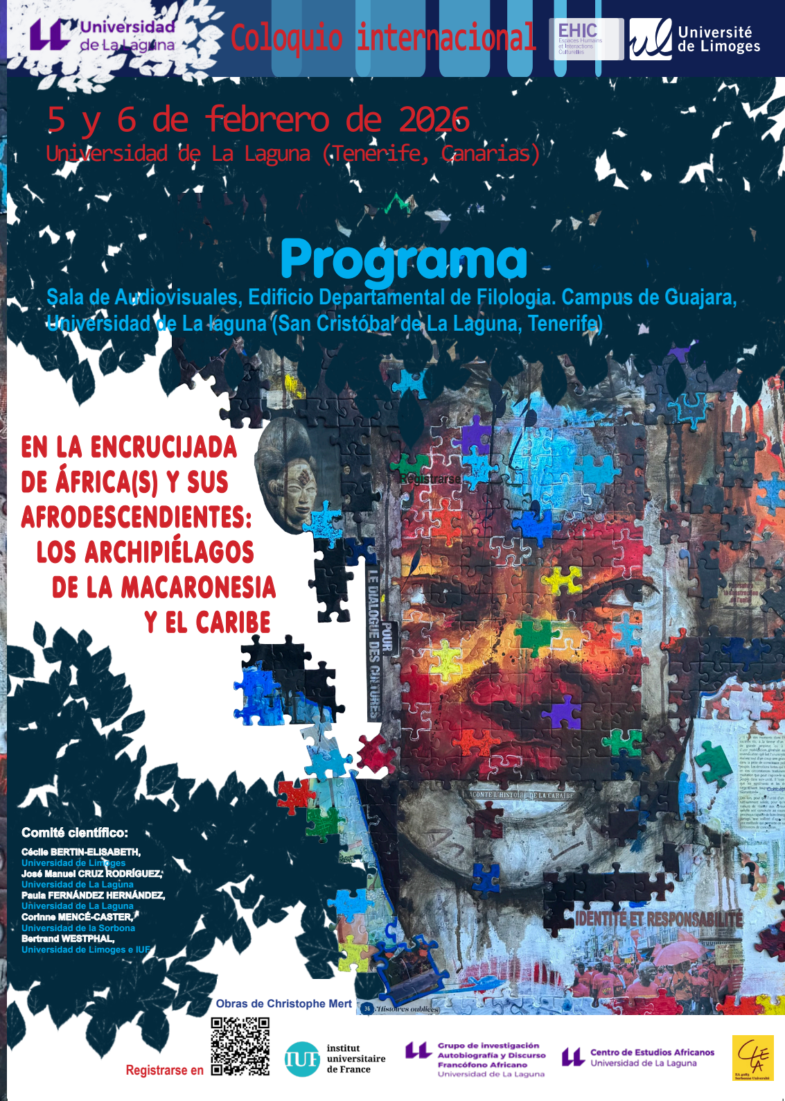
Concept - M. D. SCR. UL