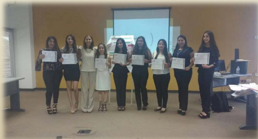
Foto grupal de ponentes y moderadora